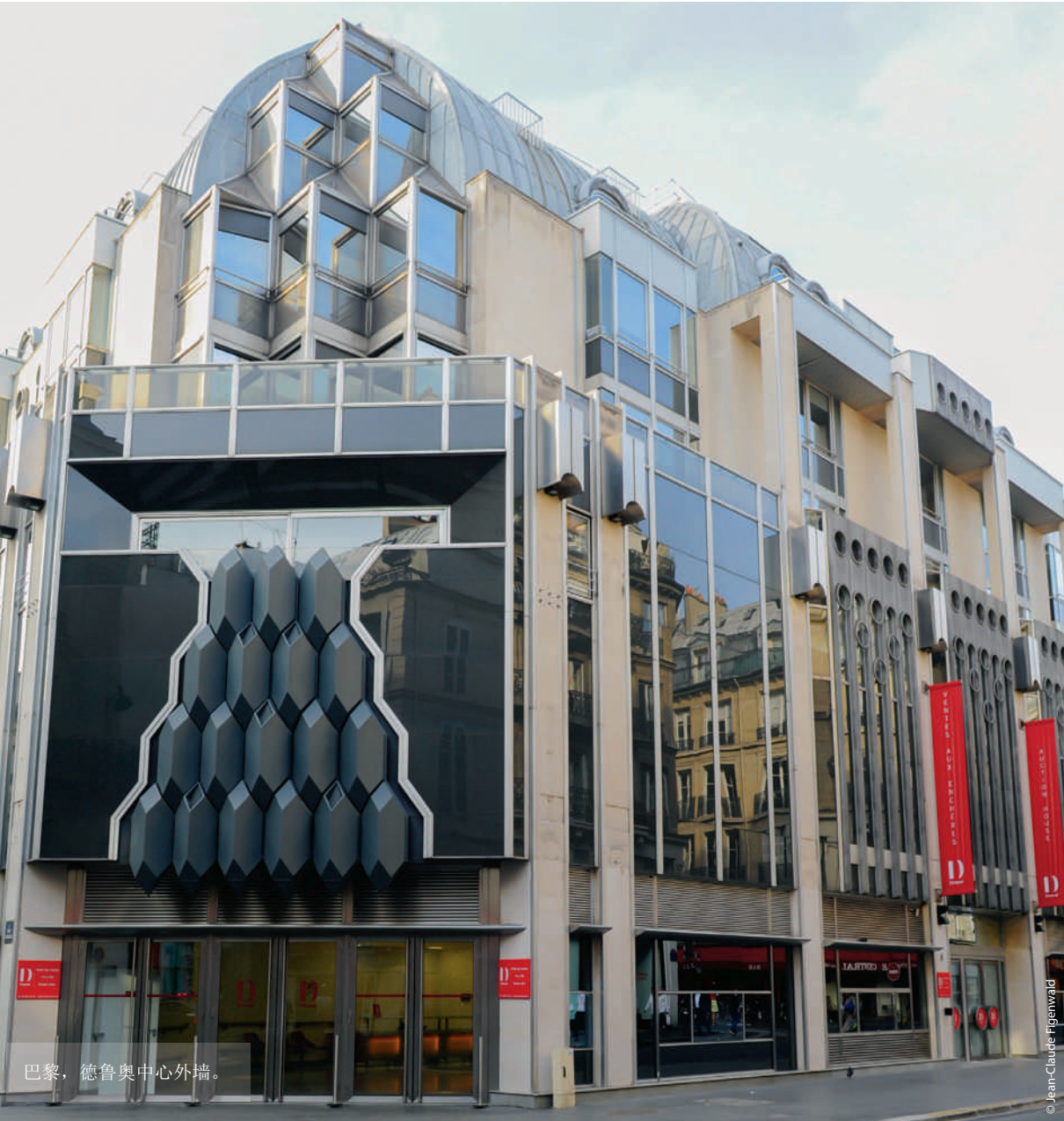
巴黎，德魯奧中心外牆。