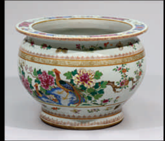
中国-清乾隆(1736-1795), 粉彩瓷缸, 60 x 44 厘米, 谱系: 2011年11月30日巴黎 苏富比拍卖会. Portier专家鉴定室, 电话: +33 1 48 00 03 41/45 SCP Studer-Fromentin.

下场拍卖：2015年6月15日周一 - 5号拍卖厅 城市艺术-设计-20世纪艺术